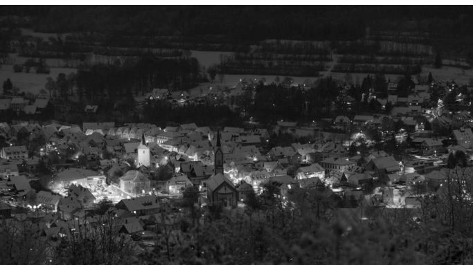
Titelbild des EBSer Adventskalenders 2018